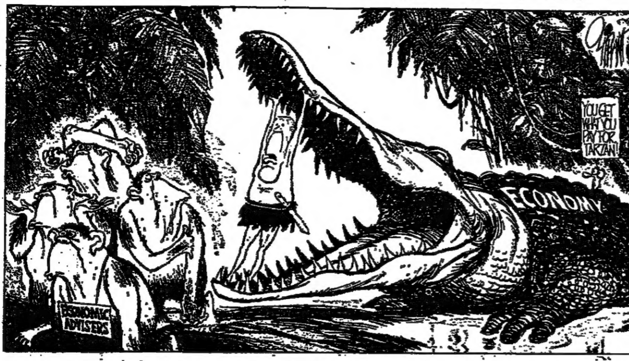
الارمة الاقتصادية في اميركا تتلعنورد، والمشاركون يفتون عاجزين... رسم في «الهيرالد تريبيون»